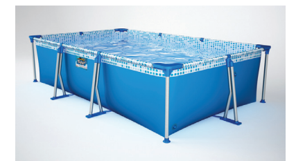
TODA LA VUELTA

Armado la pileta como lo indica el instructivo y verterle agua hasta un nivel de 2 cm. Acomodar todas las piezas correctamente y hacer que la distancia entre el regatón y el lateral del contenedor sea similar toda la vuelta, como lo indican las fotos. Terminar de llenar con agua hasta el comienzo de la soldadura superior en el lateral del contenedor, y... ¡Disfrutá de tu Pelopincho!